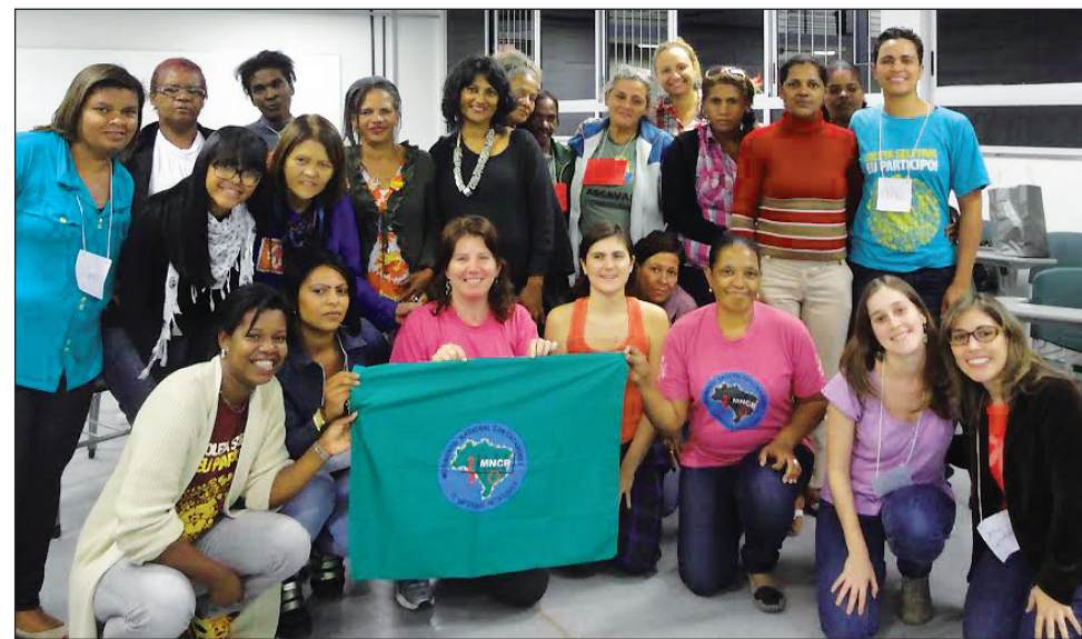
Foto de grupo de las mujeres participantes del taller para la región metropolitana de Belo Horizonte.

Los métodos participativos son esenciales para explorar los varios niveles de sumisión y discriminación que las recicladoras enfrentan, así como para crear recursos para su empoderamiento y oportunidades para su autonomía económica.