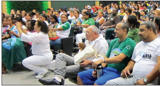
Reunión de retroalimentación sobre la primera fase del proyecto durante el Festival Residuos y Ciudadanía, 2012.

“ En la mayor parte del mundo –aun en países donde se prohíbe la discriminación en el lugar de trabajo– a la mujeres se les niega la igualdad de participación y oportunidades para formar parte de la vida pública de manera justa y digna”