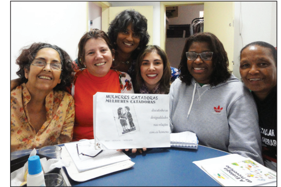
Elaborando la caja popular de herramientas de género

“ Lo que necesitamos es estar en un colectivo discutiendo sobre la autonomía; cuando se hacen las cosas en grupo, podemos avanzar nuestra autonomía... ”